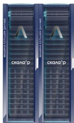
Скала^р МБД.Т К-1