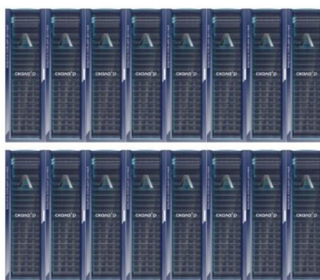
Скала^р МБД.Т К-2