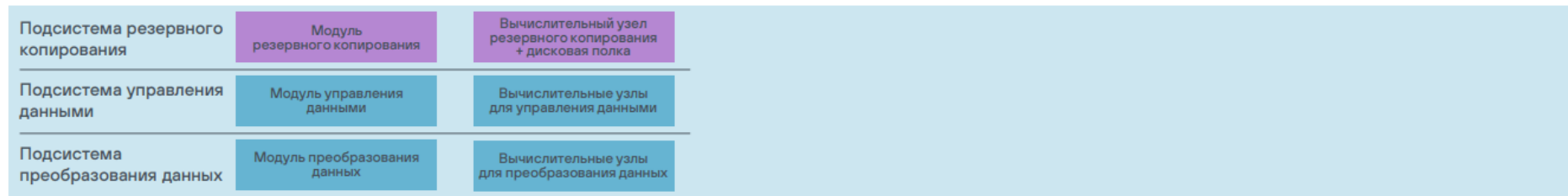
Рисунок 1. Комплектация Машины больших данных Скала^р МБД.Т